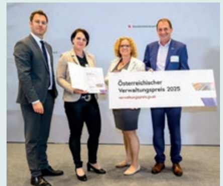
Österreichischer Verwaltungspreis 2025

Dass unser Arbeitsplatz heute ein Ort ist, wo auch viel gelacht wird und wir ein attraktiver Arbeitgeber sind, wurde auch mit der Auszeichnung beim Verwaltungspreis 2025 bestätigt.